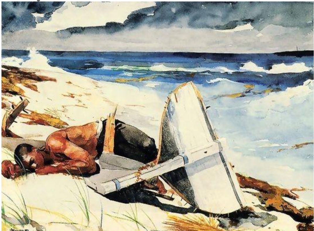
Winslow Homer (1836-1910) Po hurikánu (akvarel v majetku Art Institute of Chicago)