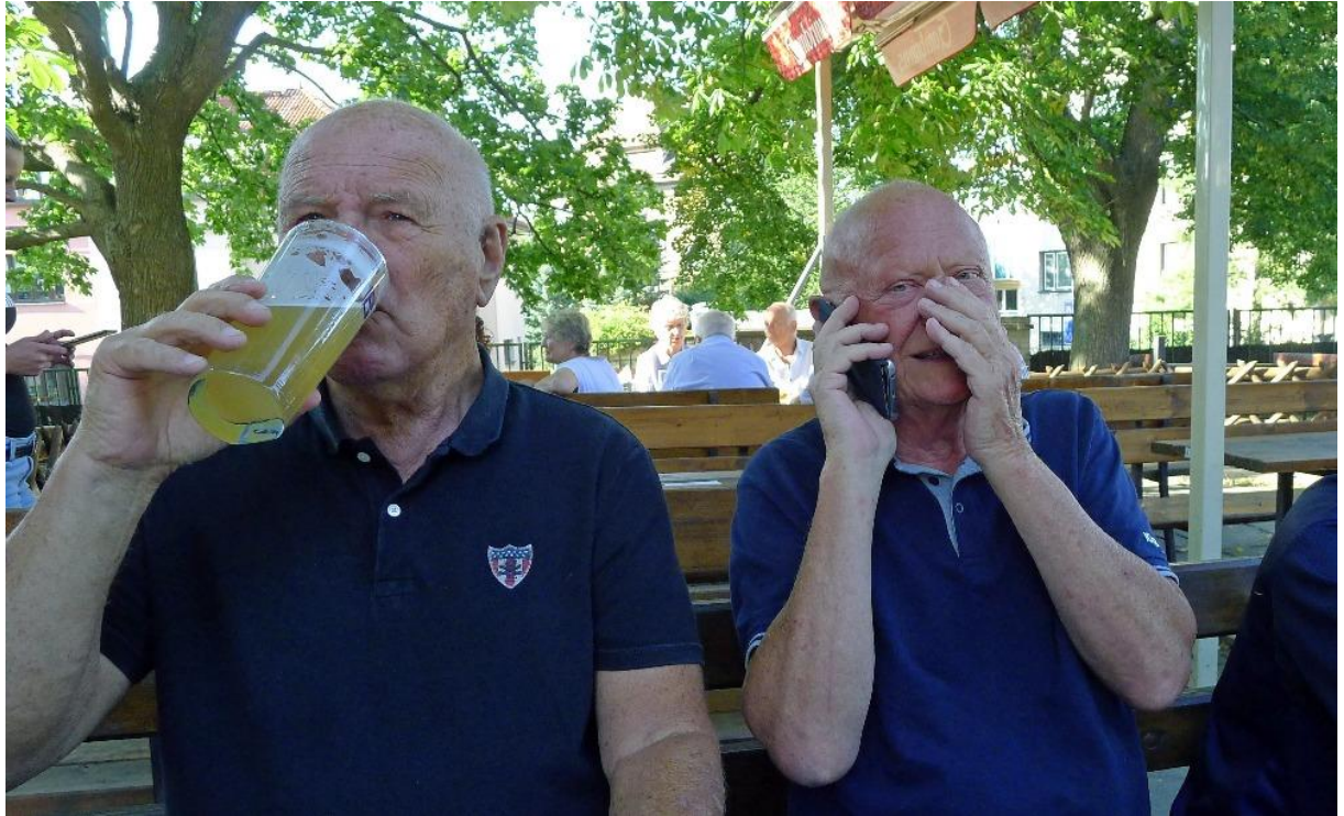
Výběr z fotografií Kačky :